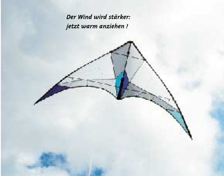
Ein Edelstein am Himmel.