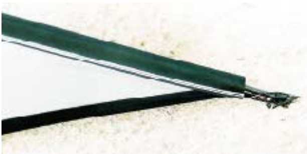
Sauber Nähte - klare Linien: Meisterklasse !

flieger, der seine Kumpels auf der Wiese in Fassungslosigkeit versetzen wird, weil der edle TOPAS überhaupt nicht diese Power erahnen lässt. Der ein oder andere fortgeschritten-sichere Synchronflieger wird sich mit ihm anfreunden können - vielleicht etwas schnell aber dafür bildschön. Für alle Freunde des Nachtflugs bietet der TOPAS mit Reflexband eine gute Möglichkeit, um einmal so richtig den Nachbarn zu erschrecken. Wie aus dieser Bandbreite zu erkennen ist, „fliegt“ man einen derartigen Drachen nicht einfach, nein: hier muss ein anderer Begriff her. Wenn also die Ehefrau fragt: „Was hast du jetzt vor, Schatz?“ , heißt die richtige Antwort: „Ich werde noch ein Stündchen topasieren.“